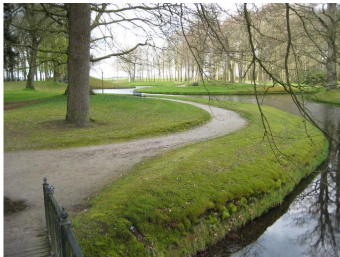
Stania State met kenmerkende slingerpaden van Roodbaard.

De wandelroute komt in Oentsjerk eerst nog door het park van Heemstra State. De state is vervangen door een bejaardenhuis, maar park en bos bleven bewaard, met daarin een grafheuvel van het paard, dat in 1812 een Heemstra gered zou hebben over de Berezina tijdens Napoleons terugtocht uit Rusland.