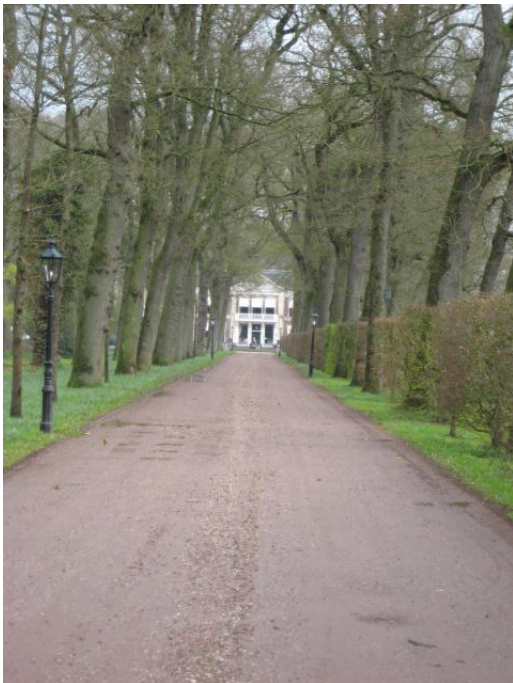
Landgoed De Klinze met fraaie oprijlaan

Tussen Aldtsjerk en Readtsjerk liggen de smalle, maar gevarieerde bossen Grikelân en Turkije, ooit aangekocht door een Van Sminia met staatspapieren van die landen. Ze zijn sinds 1955 van It Fryske Gea.